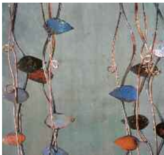
NATURA MARINA - Rame smaltato

Ritroviamo in Branca lo stesso piacere fiabesco per un di-