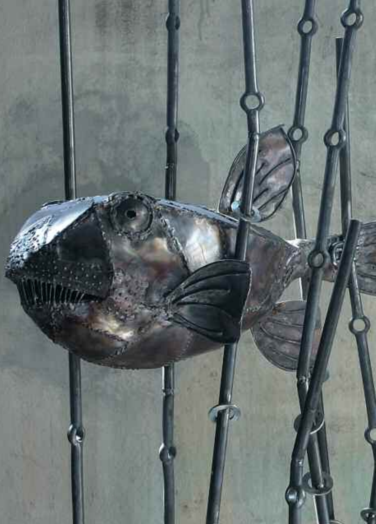
NATURA MARINA Rame saldato ed ossidato